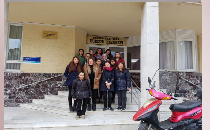
HUZUR EVİ ZİYARETİMİZ