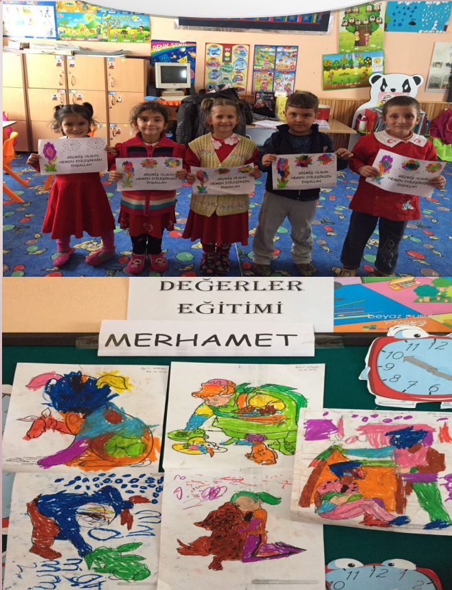
DEĞERLER EĞİTİMİ ETKİNLİKLERİMİZ