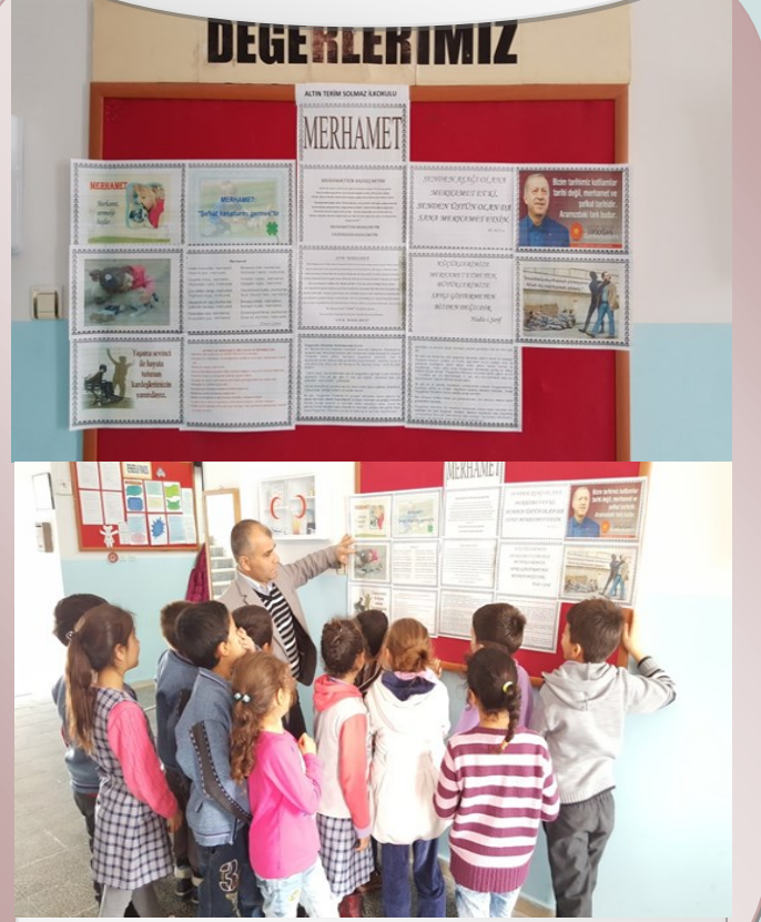
OKUL İÇİ ETKİNLİKLERİMİZ