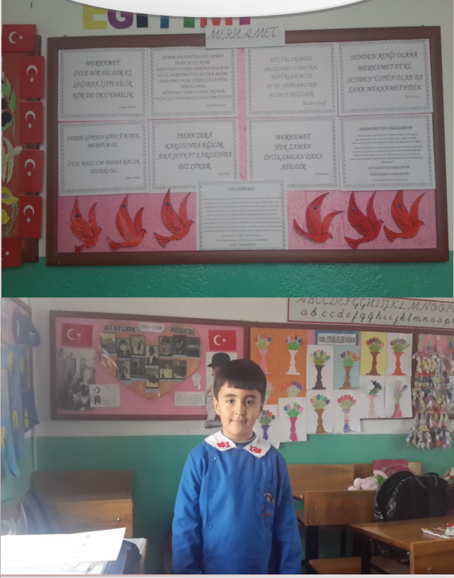
ÖĞRENCİLERİMİZİN PANO ÇALIŞMALARI